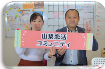
婚活アドバイザーが 終日同行します!