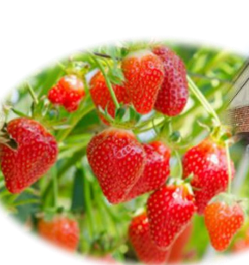
いちご狩り※イメージ