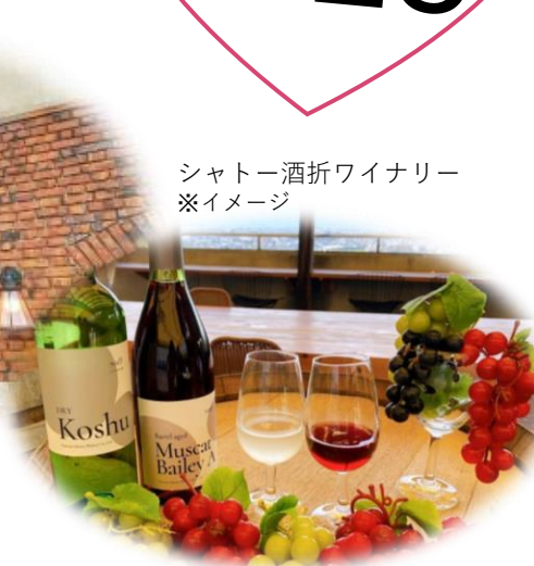
シャトー酒折ワイナリー ※イメージ