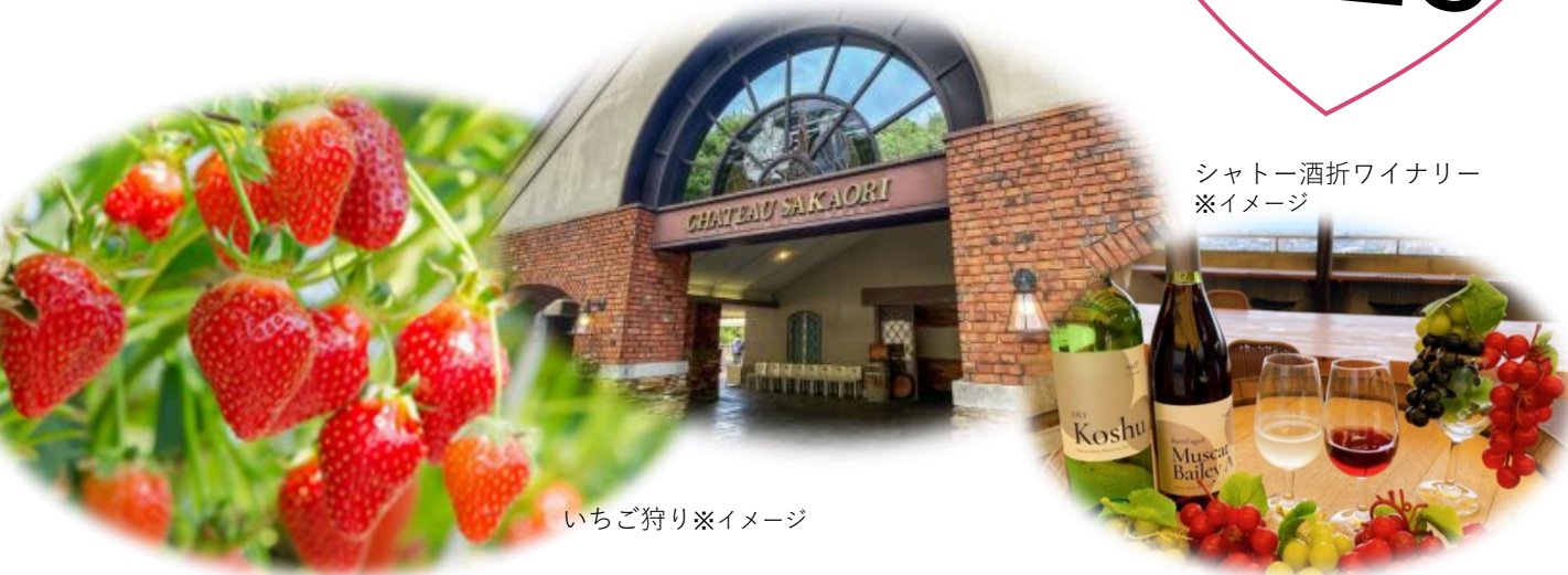
シャトー酒折ワイナリー ※イメージ